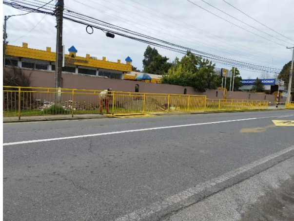
Barandas de protección instaladas en la vereda del colegio.