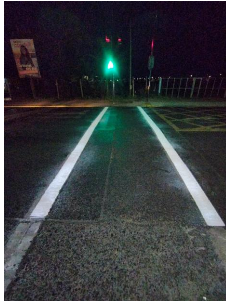
Semáforo peatonal habilitado para mayor seguridad.