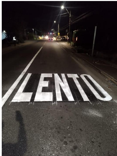
Demarcación vial 'LENTO' para reducir la velocidad vehicular