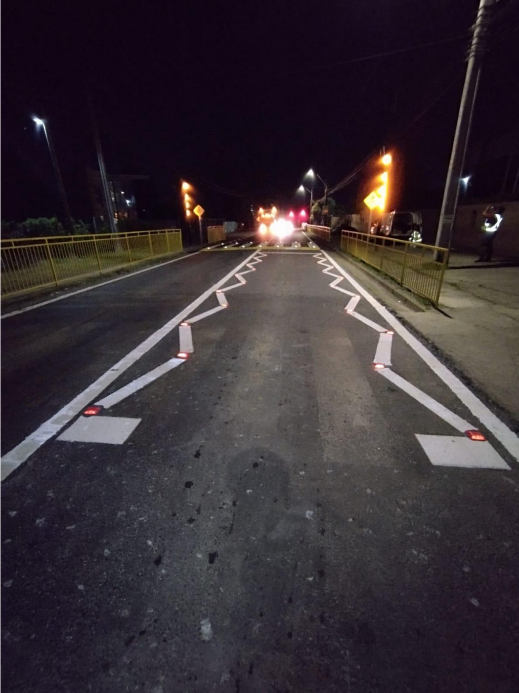
Demarcación vial nocturna con iluminación reflectante.