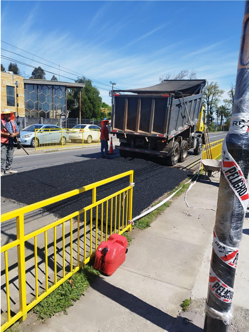
Pavimentación de la vía frente al colegio.