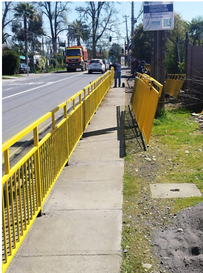
Acceso protegido para estudiantes y familias.