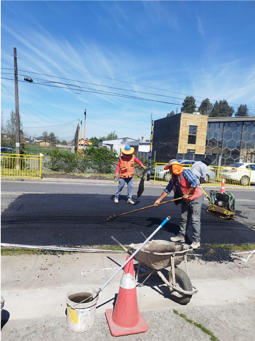
Semáforo peatonal y cruce protegido frente al colegio.