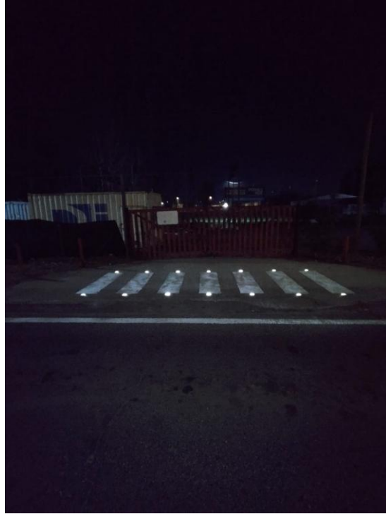
Cruce peatonal iluminado con balizas de seguridad.