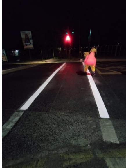
Cruce peatonal con señalización de semáforo.