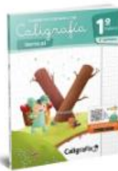
Caligrafía vertical 1º básico 2º semestre