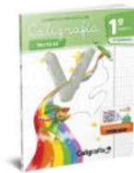
Caligrafía vertical 1º básico 1er semestre